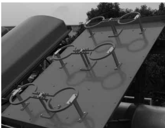
〈写真2〉 パネル内部に納められた3素子2L双ループ・アンテナ

東京タワーを利用する地上デジタル・テレビ放送に割り当てられたチャンネル番号と周波数は、表1のとおりです。